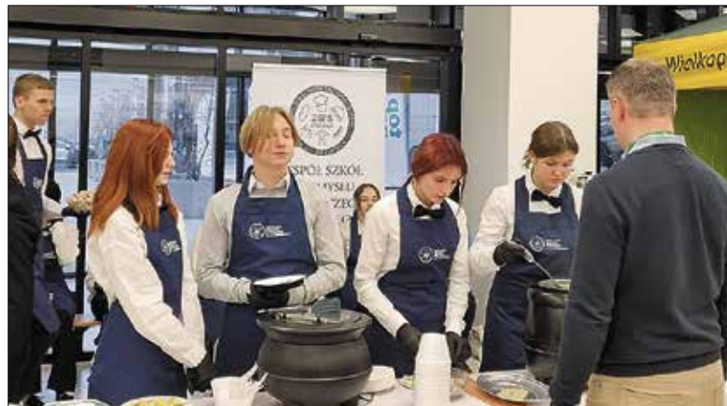
Przy stoisku WIR tradycyjnie odbyło się śniadanie wielkopolskie. Przy obsłudze pomagali uczniowie ZSPS im J.J. Śniadeckich w Poznaniu

wicielom szeroko rozumianego sektora żywnościowego za wkład w zapewnienie bezpieczeństwa żywnościowego w obliczu aktualnie trwającej wojny. Komisarz wskazał, że ostatnie kilkanaście miesięcy to był ciężki czas. Najpierw pandemia COVID-19, a obecnie trwająca wojna wywróciły porządek świata. W konsekwencji trwającej wojny borykamy się z olbrzymimi podwyżkami cen gazu, co finalnie prowadzi do horrendalnie wysokich cen nawozów. Jednakże mimo wszelkich trudności rolnicy nadal produkują żywność oraz dostarczają ją na rynek, za co komisarz bardzo dziękuje. Komisarz w swoim wystąpieniu odniósł się także do danych z Europejskiego Spisu Rolnego 2020 i wskazał, że między