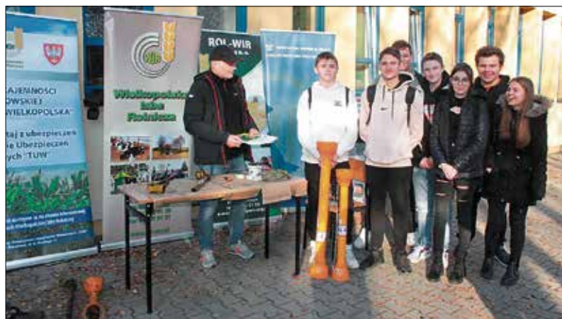
Prawie 800 rolników zaopatrzyło się w nowe osłony

Nabory chcących wymienić osłony prowadziły Biura Powiatowe Wielkopolskiej Izby Rolniczej oraz szkoły rolnicze. Wymieniane były osłony wałów będących na wyposażeniu szkół oraz gospodarstw indywidualnych. Szkoły kształcące w kierunkach rolniczych, gdzie realizowana była akcja, to szkoły, z którymi Wielkopolska Izba Rolnicza zawarła porozumienia o współpracy. Porozumienia odnoszą się nie tylko do zadań związanych z kształceniem uczniów w zawodach rolniczych, lecz także do realizacji inicjatyw odnoszących się do bezpieczeństwa pra-