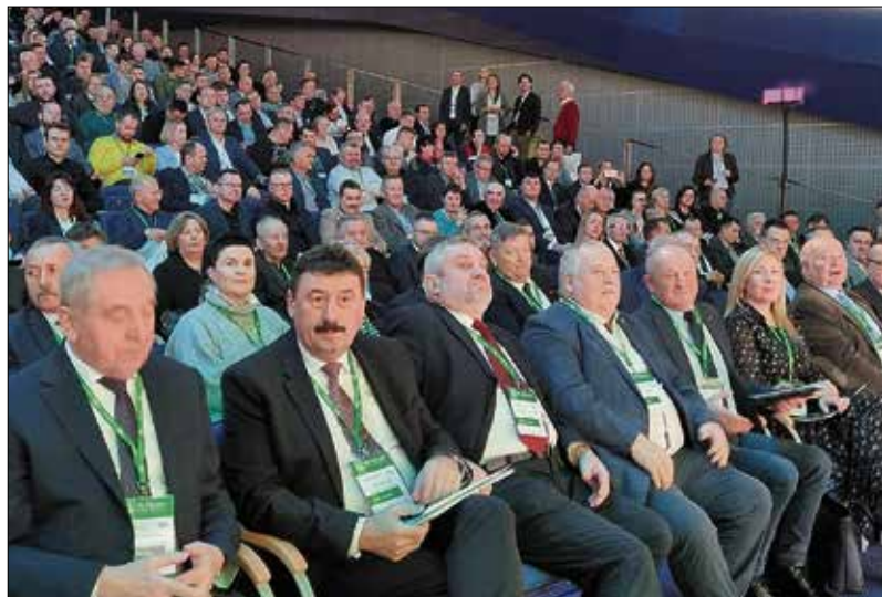
W Sali Ziemi zgromadziło się ponad 1000 osób

można było zadawać pytania ministrowi. Rolnik z Małopolski wskazał, iż firmy ubezpieczeniowe nie chcą ubezpieczać pewnych upraw rolnych – w tym przypadku chodziło o cebulę i czosnek. Minister obiecał, że zweryfikuje szczegóły i z pewnością w tej sprawie zainterweniuje. Uczestnicy Forum zadawali także pytania odnośnie tzw. „pomocy suszowej” Zachęcali ministra do wdrożenia definicji aktywnego rolnika, podając jak taka definicja powinna brzmieć.