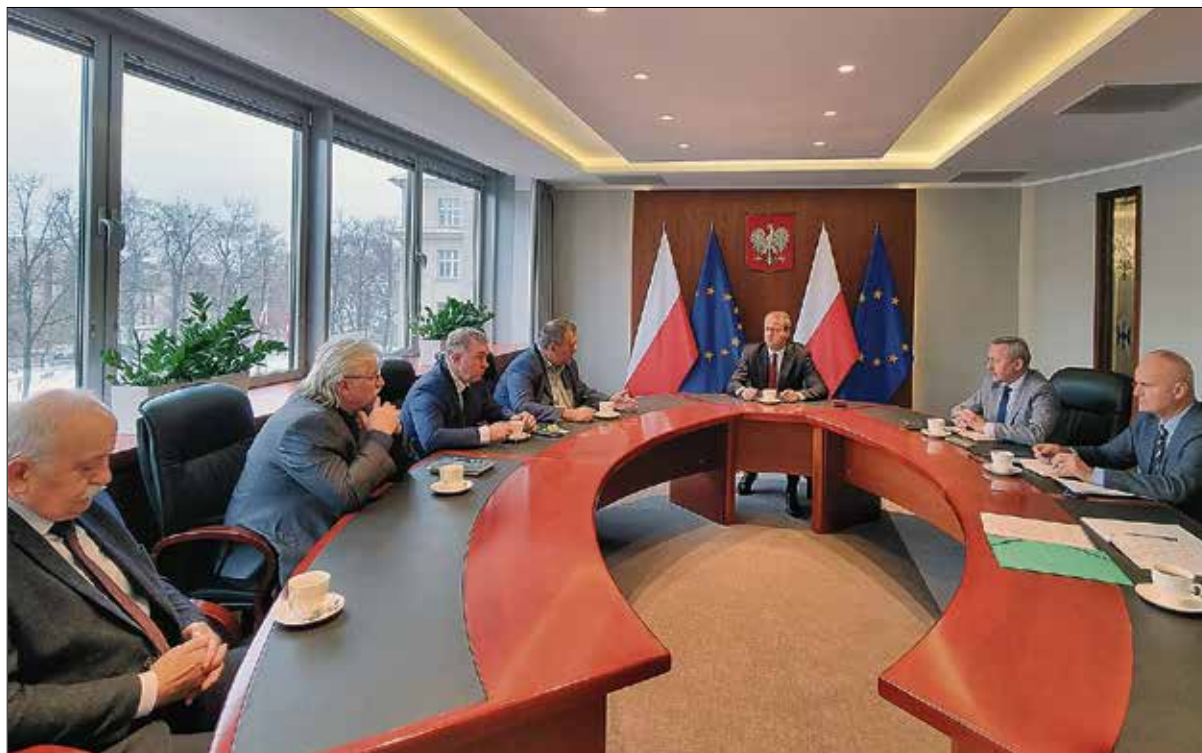
Spotkanie wojewody wielkopolskiego z zarządem WIR

2023 r. znaczącej reformy Wspólnej Polityki Rolnej i Krajowego Planu Strategicznego (KPS). Rolnicy w tym okresie będą podejmowali kluczowe decyzje dotyczące składowania wniosków o dopłaty bezpośrednie i wykorzystania możliwości, jakie dają nowe mechanizmy w postaci ekoschematów. Ta wiedza będzie