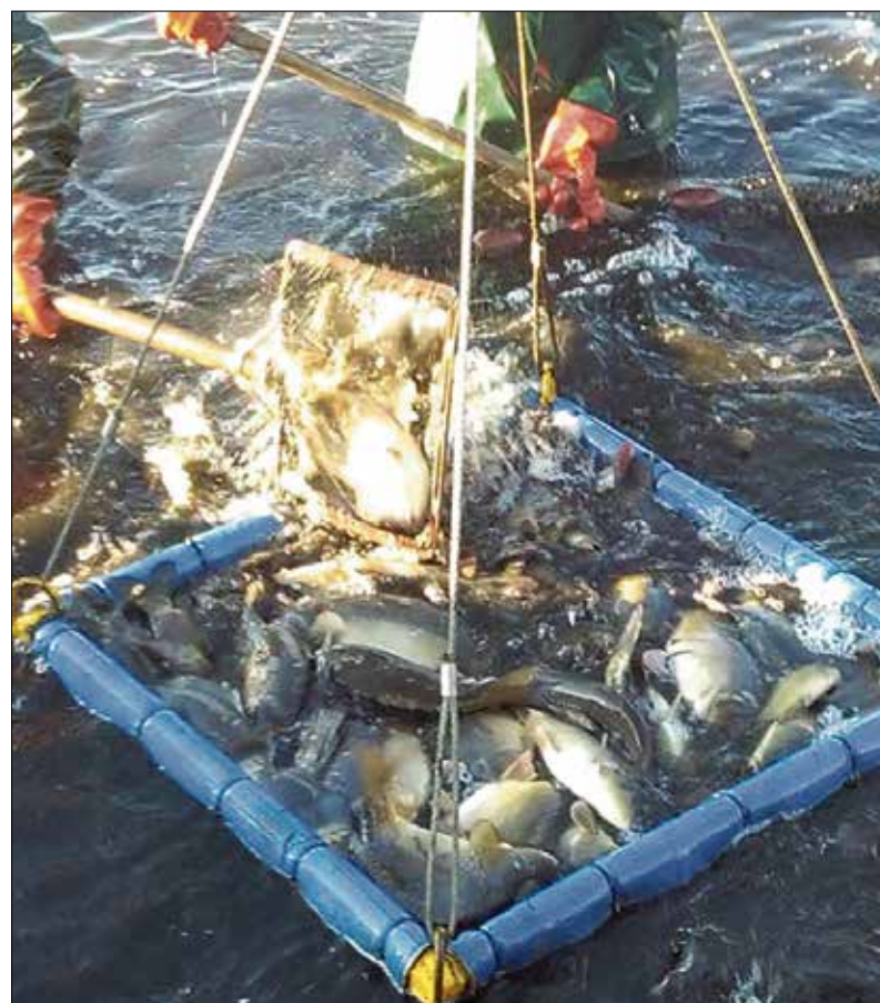
Zamówienia na karpia z Przygodzic można realizować pod nr tel. 62 736 62 58

Gospodarstwa rybackie zaczynają w listopadzie sprzedawać karpia,