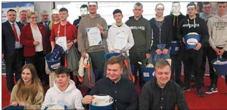
Laureaci konkursu „Dzień z życia młodego rolnika”