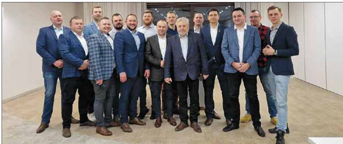
Spotkanie Rady Młodych Rolników przy KRIR odbyło się 12 stycznia przy okazji Targów Polagra Premiery. 13 stycznia Rada wzięła udział w Dniu Młodego Rolnika

Tematów do omówienia było bardzo dużo, między innymi: WPR,