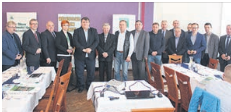
Forum Rolnicze w Środzie Wielkopolskiej

Jednym z głównych tematów była sprawa obrotu ziemią z zasobów Skarbu Państwa. Dyskutantom chodziło głównie o niejasne kryteria jakie zostały opracowane przez ANR. Skrytykowano jednoznacznie sposób wy-