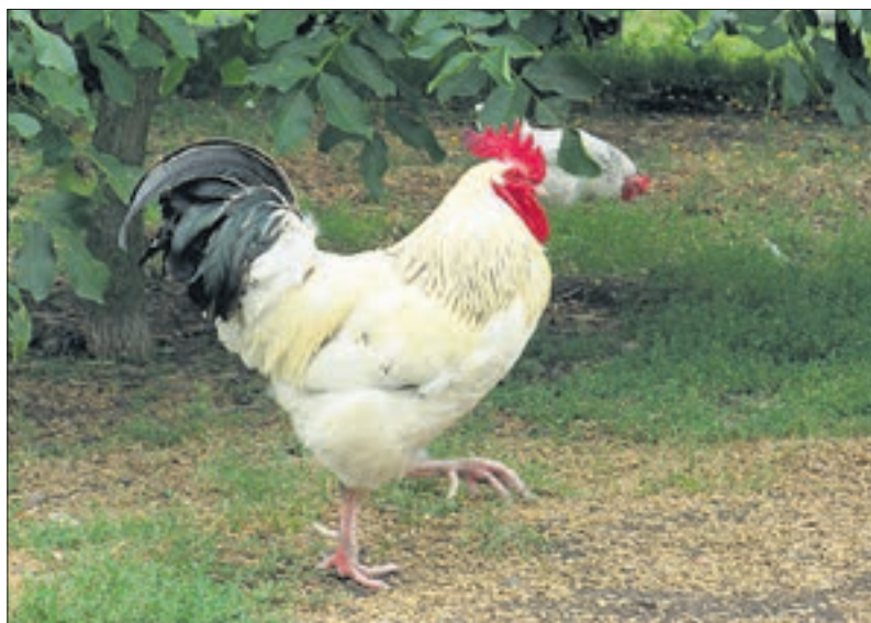
Ptasia grypa w odwrocie

Zagrożenie związane z grypą ptaków nie ustąpiło całkowicie i posiadacze drobiu powinni w odpowiedzialny sposób postępować w swoich gospodarstwach. Nowe przepisy mówią przede wszystkim o ograniczeniu dostępu drobiu do otwartych zbiorników wodnych. Hodowcy i producenci powinni starać się wypuszczać drób na terenie gospodarstwa, gdzie przebywa człowiek, co w naturalny sposób będzie odstraszało dzikie ptactwo od przebywania w zbyt bliskiej odległości. W gospodarstwach stosowane mogą być również ultradźwiękowe odstraszacze, siatki, itp. sposoby mające na celu ograniczenie do minimum ryzyka kontaktu z dzikim ptactwem, drób ma być karmiony i pojoyony w sposób zabezpieczający paszę i wodę przed dostępem