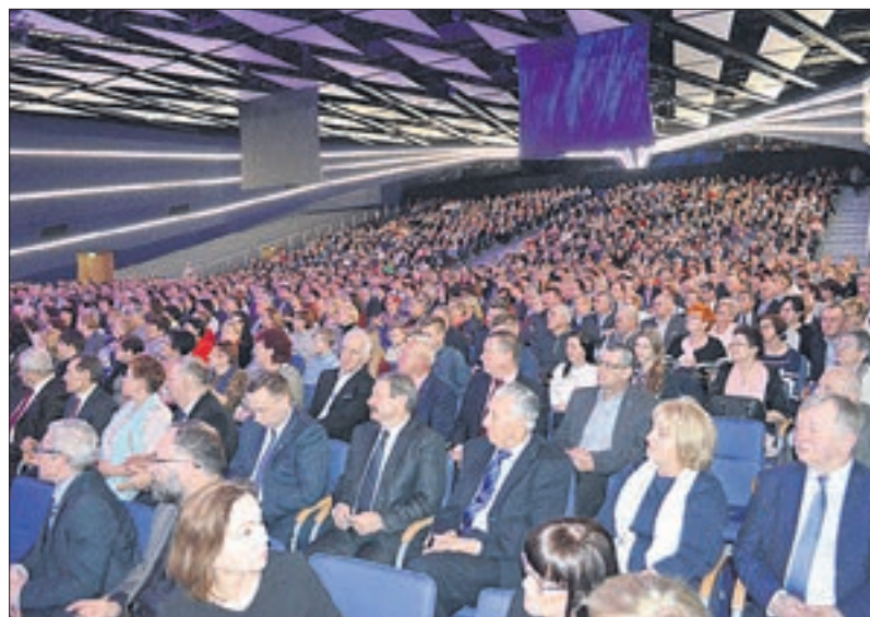
W uroczystej Gali wzięli udział rolnicy z całej wielkopolski