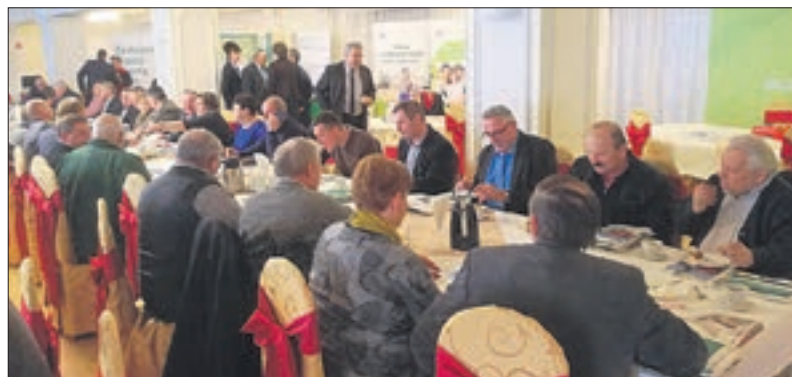
Dębno Polskie – Forum Powiatu Rawickiego

Poszczególni prelegenci zreferowali poszczególne tematy, przekazując najnowsze informacje dotyczące rolnictwa i obszarów wiejskich. Sporo uwag wywołał projekt rozporządzenia Ministra Rolnictwa i Rozwoju Wsi w sprawie szczegółowych wymagań weterynaryjnych dla prowadzenia działalności w zakresie utrzymania zwierząt gospodarskich. Zgodnie z projektem rolnicy prowadzący produkcję zwierzęcą powinni m.in. prowadzić rejestry pojazdów wjeżdżających i wyjeżdżających z gospodarstwa, a obiekty, w których jest prowadzona produkcja zwierzęca powinny być zabezpieczone przed innymi zwierzętami niż utrzymywane, w tym również przed kotami i psami. Drugim gorącym tematem była sprawa planów nowych odkrywek węgla brunatnego w gminach Krobica, Miejska Górka i Poniec. Rolnicy byli zgodni, że eksploatacja złoża Oczkowiec zniszczy wysokoefektywne rolnictwo regionu leszczyńskiego. WIR