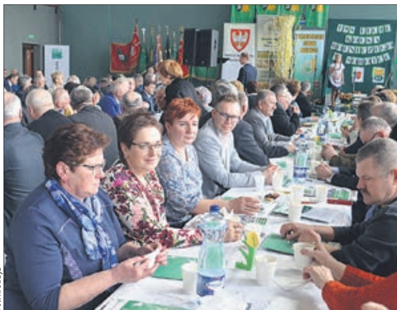
W Jubileuszu wzięło udział kilkaset osób

Panie przygotowały wystawę ręcznie wykonanych prac, wśród