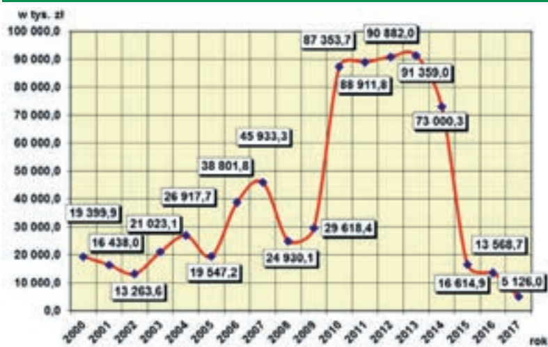
Wysokość środków finansowych pozyskanych z różnych źródeł na realizację zadań inwestycyjnych w latach 2000–2017