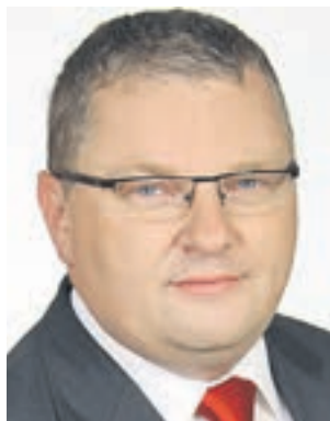
Krzysztof Grabowski, wicemarszałek województwa wielkopolskiego

lokalnych. Natomiast w ramach realizowanego od 2013 r. konkursu „Odnowa wsi szansą dla aktywnych sołectw” będzie można uzyskać wsparcie na zakup drobnych elementów wyposażenia świetlic wiejskich, towarów służących kultywowaniu tradycji społeczności lokalnych, a także materiałów niezbędnych do promocji wsi. Z kolei otwarty konkurs ofert dla organizacji pozarządowych „Nasza wieś naszą wspólną sprawą” dotyczy