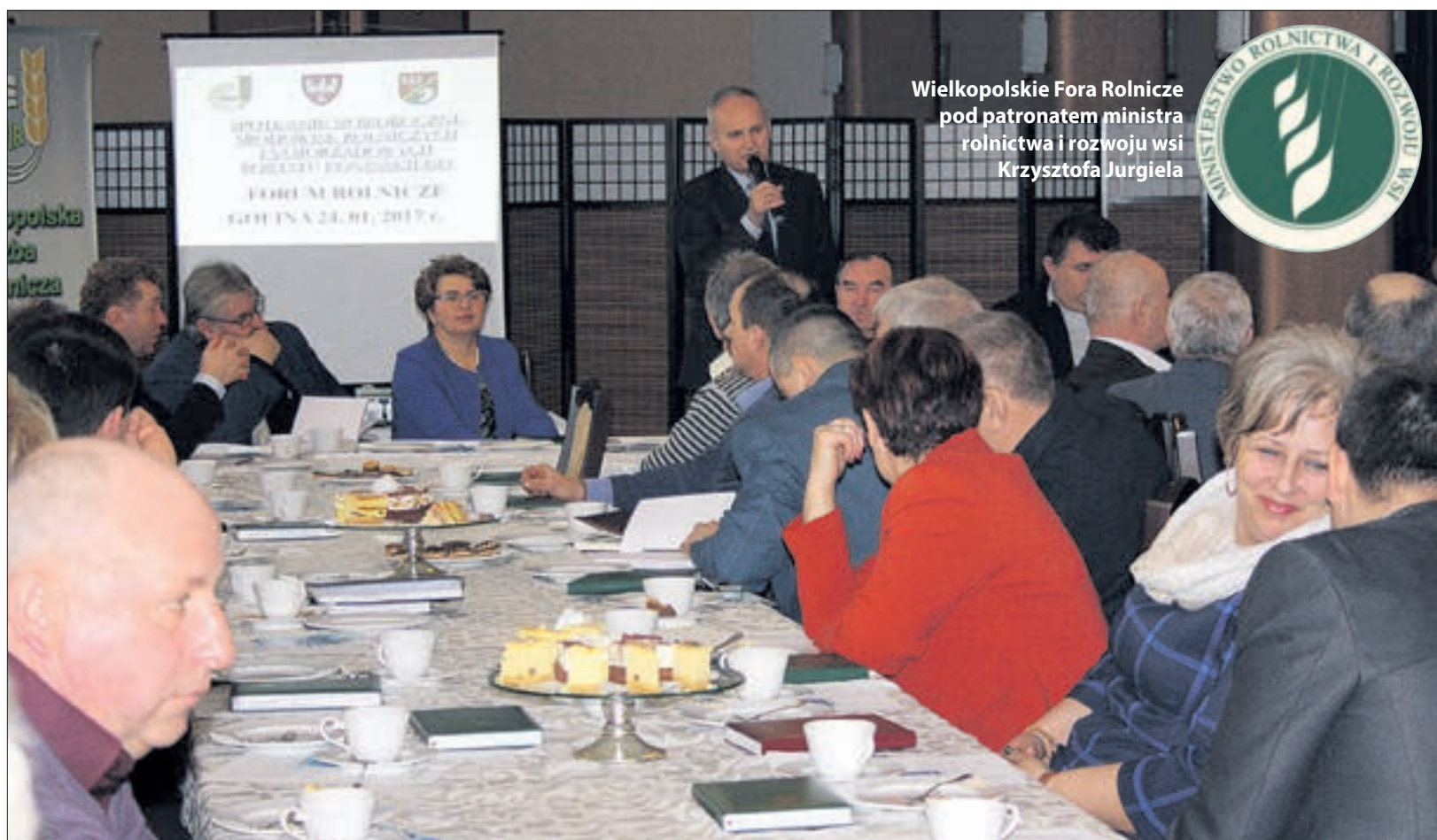
Wielkopolskie Fora Rolnicze pod patronatem ministra rolnictwa i rozwoju wsi Krzysztofa Jurgieła