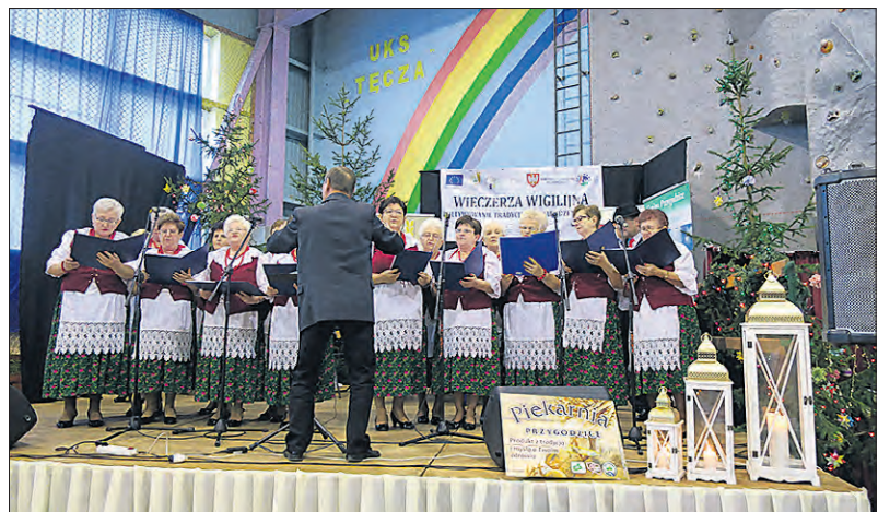
Kolędy śpiewano wspólnie z zespołami „Baryczanki” i „Kalina”