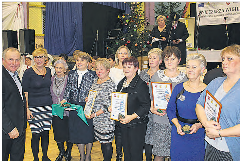
Laureaci konkursu na tradycyjne ciasto świąteczne