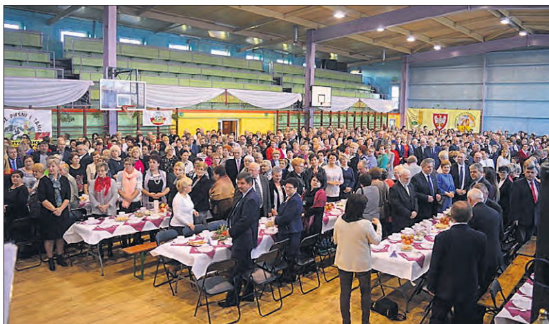
W bożonarodzeniowym spotkaniu wzięło udział ponad tysiąc osób z całej Wielkopolski

Z okazji 150-lecia kół gospodyń wiejskich oraz 120-lecia utworzenia samorządu rolniczego na ziemiach polskich Wielkopolska Izba