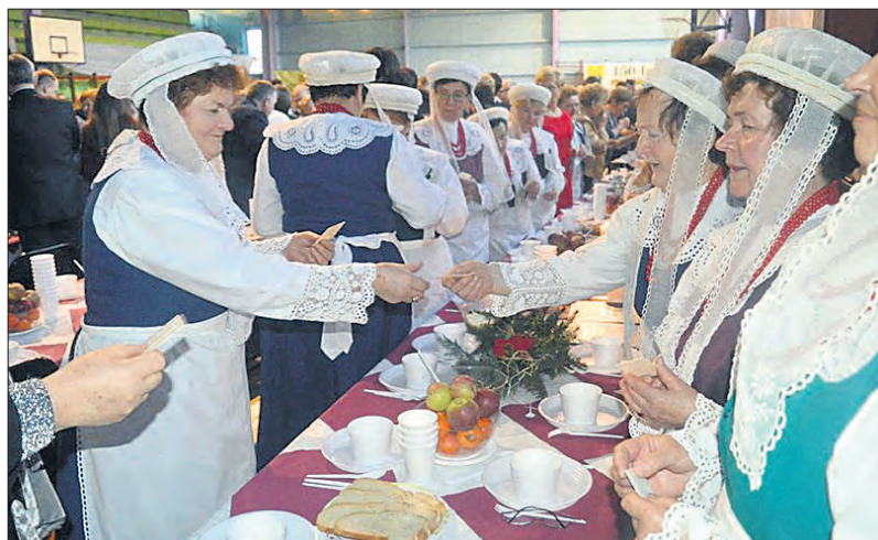
Wigilie, jak tradycja każe, rozpoczęto od podzielenia się opłatkiem