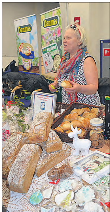
Chleb z Sycyny

W ramach wystawy powstały także stoiska konsultacyjno-informacyjne instytucji działających w otoczeniu rolnictwa: Agencji Nieruchomości Rolnych, Centrum Doradztwa Rolniczego, Wielkopolskiego Inspektoratu Sanitarnego, Agencji Restrukturyzacji i Modernizacji Rolnictwa, Agencji Rynku Rolnego oraz Wielkopolskiej Izby Rolniczej. Dodatkowo zorganizowany został punkt informacyjny, gdzie zainteresowane osoby mogły uzyskać informacje z zakresu sprzedaży bezpośredniej oraz promocji produktów wytworzonych w rodzinnych gospodarstwach. W ramach punktu informacyjnego porad udzielali specjaliści z Centrum Doradztwa Rolniczego Brwinów oddział w Radomiu i Poznaniu oraz z Wielkopolskiej Izby Rolniczej. Z porad udzielanych w ramach punktu informacyjnego skorzystali odwiedzający wystawę oraz sami wystawcy. Najwięcej pytań dotyczyło