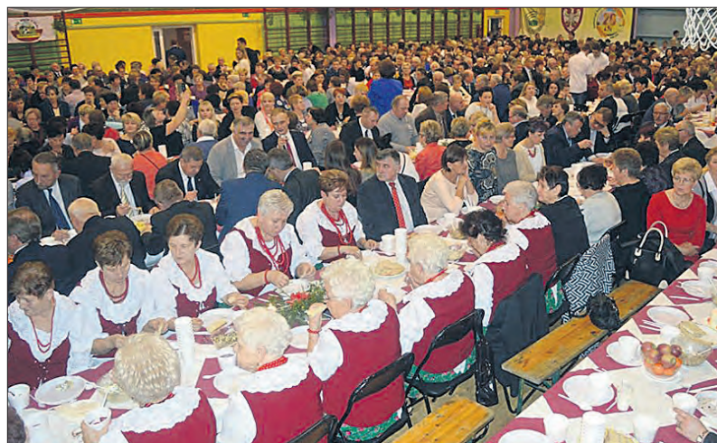
Wieczera wigilijna środowisk wiejskich gromadzi przy świątecznym stole przedstawicieli środowisk wiejskich z całej Wielkopolski