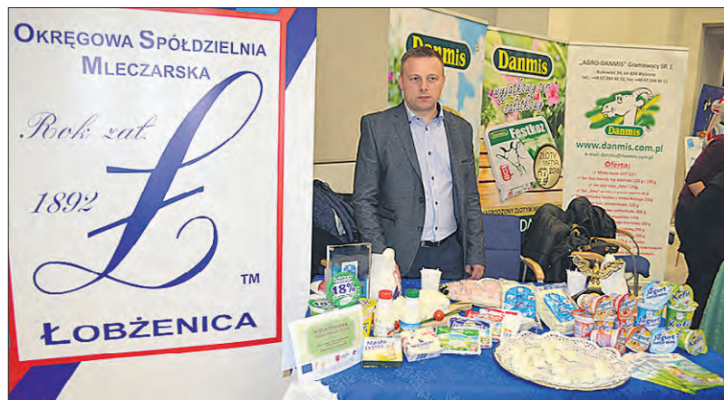
Okręgowa Spółdzielnia Mleczarska Łobżenica z powiatu pільskiego