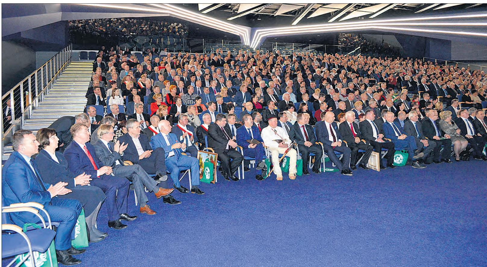
W uroczystej gali wieńczącej obchody jubileuszu wzięło udział blisko tysiąc osób