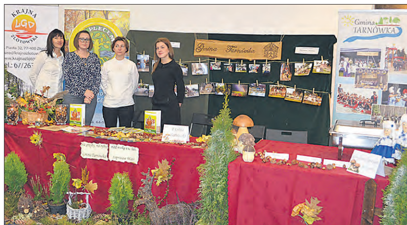
Stoisko Pań z Kół Gospodyń Wiejskich z gminy Tarnówka

Wystawa realizowana była w ramach środków z Krajowej Sieci Obszarów Wiejskich na lata 2016–2017 w Województwie Wielkopolskim i ma na celu promocję lokalnych produktów oraz propagowanie sprzedaży bezpośredniej jako formy dodatkowej działalności dla rolników. WIR