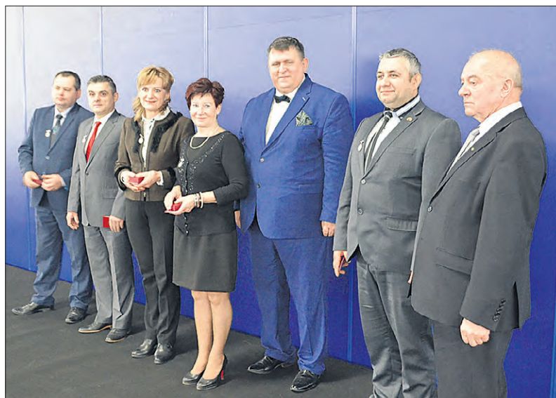
Odznaczeni odznaką honorową „Zasłużony dla rolnictwa” nadaną przez ministra rolnictwa

Najwyższe wyróżnienie Wielkopolskiej Izby Rolniczej, Medalion im. dr. Aleksandra hr. Szembeka, zarząd WIR wręczył następującym osobom: