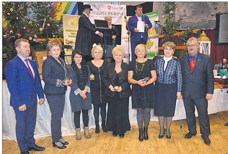
Przedstawicielki Kół Gospodyń Wiejskich otrzymały pamiątkowe medale