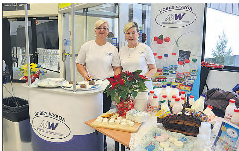
Na stanowisku Spółdzielni Mleczarskiej Września częstowano zikiem wrzesińskim

nowej ustawy dotyczącej sprzedaży bezpośredniej, która wejdzie w życie na początku 2017 roku. Na stoisku rozdawano także materiały informacyjne oraz prasę rolniczą.